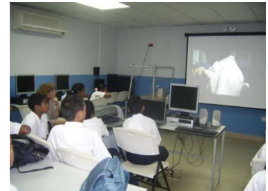
Foto 5, 6 y 7: Estudiantes del área de Colón y del área de Panamá Oeste observando video de proyecto colaborativo entre 2 escuelas.