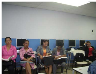
Foto 2: Reunión de docentes en el Centro Educativo Lídice, Distrito de Capira.