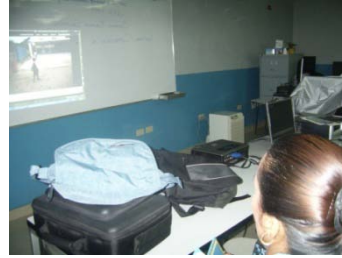
Foto 3 y 4: Docentes del Centro Educativo Berta Elida Fernández observando videos de Proyecto Colaborativos exitosos.