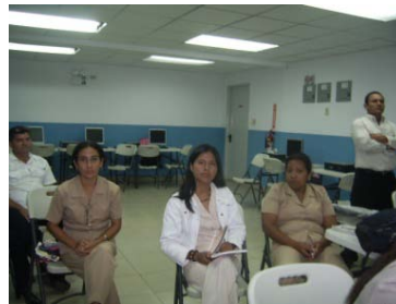
Foto 1: Reunión de docentes en la Centro Educativo Sajalices, Distrito de Chame