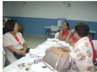
Foto 8 y 7: Directores y CAI's del Centros Educativos de Chame compartiendo ideas de cómo compartir y Ejecutar el Proyecto Colaborativo Pequeños Guardianes del Manglar de la Bahía de Chame