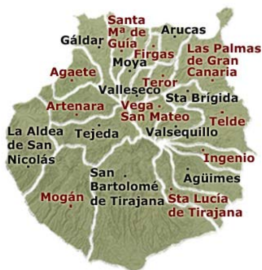
..... Municipios de Gran Canaria .....

En el mismo centro de la isla sobretodo en su vertiente sur, habría que destacar también la existencia de grandes presas a modo de pequeños lagos que vienen a aportar una nota característica más al paisaje de la zona, como serían las presas de Chira, presa de Las Niñas y la presa de Soria por ejemplo.